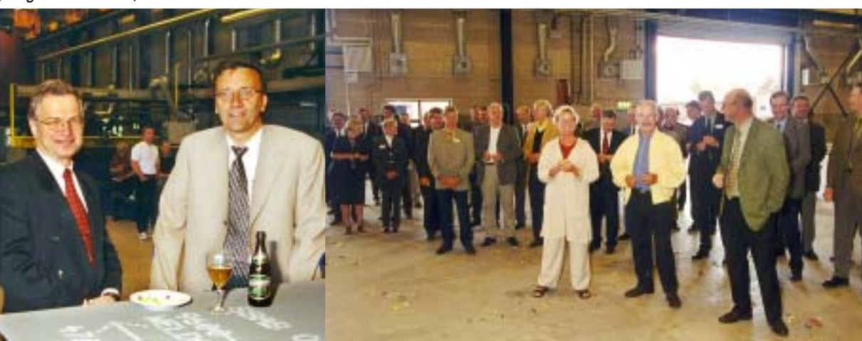
Gäster i väntan på invigningstal.