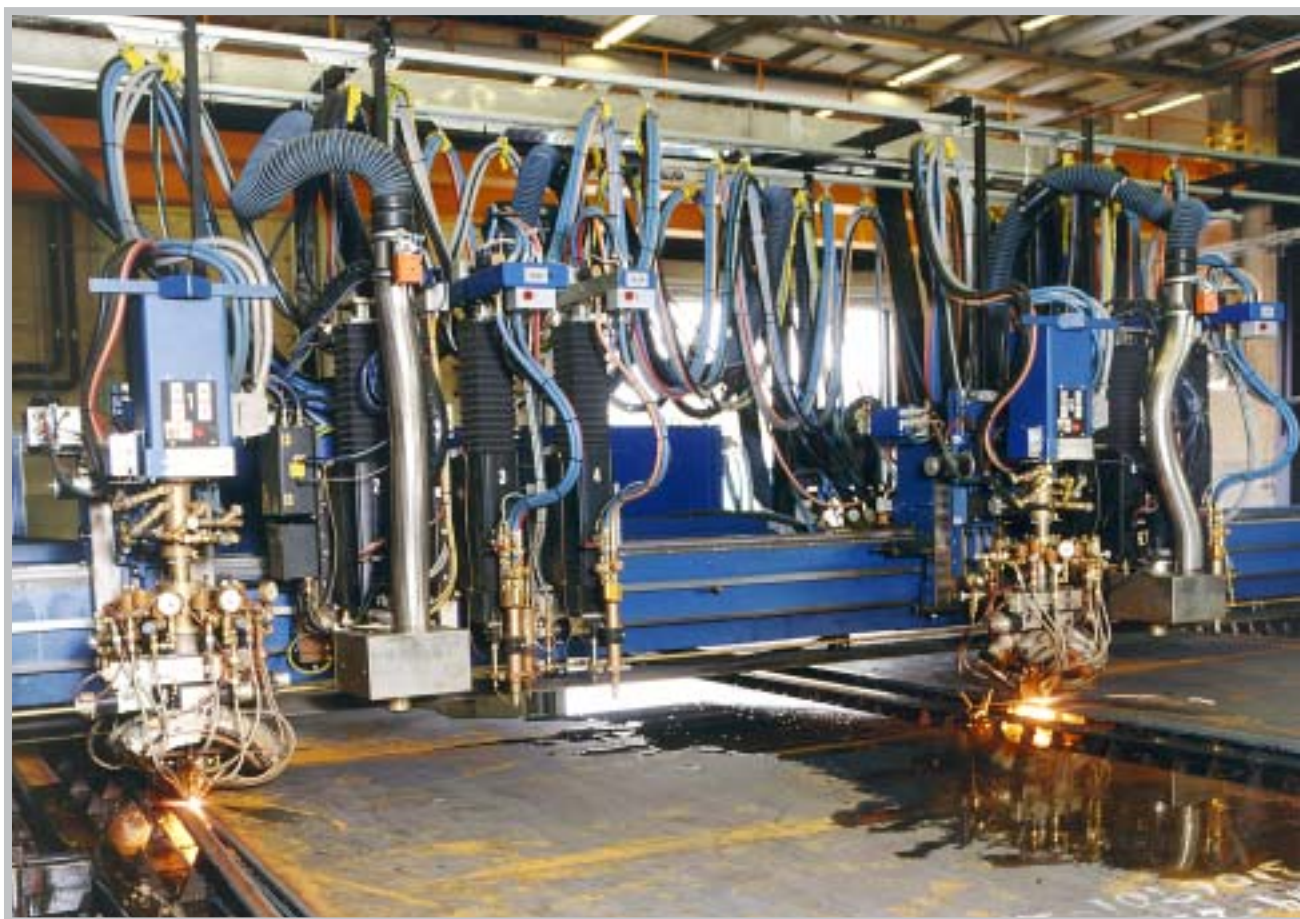
Maskinen klarar skärning i dubbelt upplägg.

Gasskärning, som är en väl beprövad metod, är bäst lämpad för skärning av grövre plåt. För att också kunna skära tunna plåtar effektivt är maskinen kompletterad med plasmaskärning.