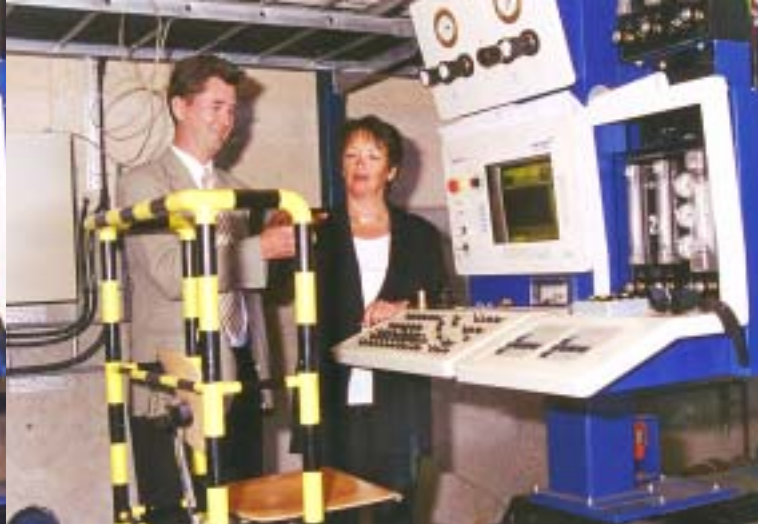
...fatta varandras händer...