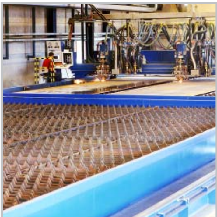
Skäranläggningen är imponerande stor.

Den är imponerande stor, Smidesbolagets nya maskin för gas- och plasmaskärning. 39 meter lång. Elva meter bred. Och konstruerad för skärning av härdad plåt i dubbelt upplägg.