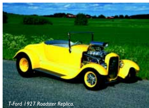
T-Ford 1927 Roadster Replica.