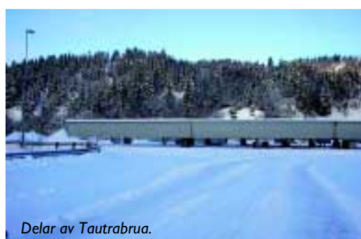
Delar av Tautrabrua.