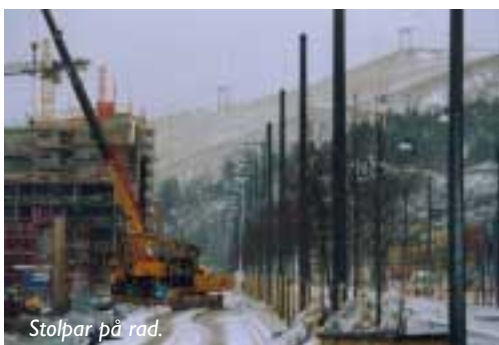
Stolpar på rad.

– Infrastrukturen är förstås oerhört viktig och den nya Tvärbanan får en nyckelfunktion. Det handlar om en