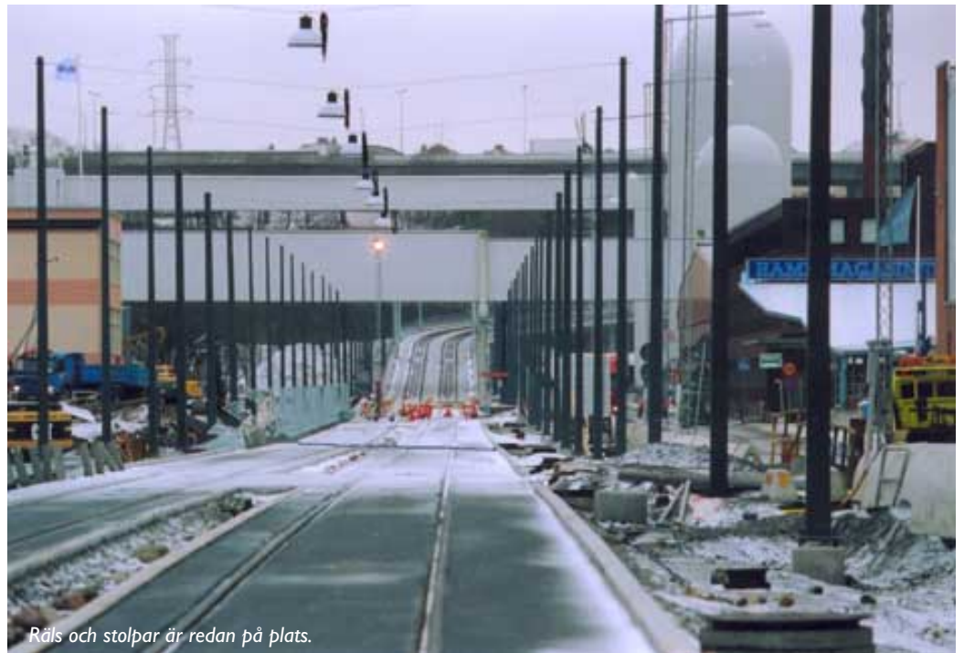
Räls och stolpar är redan på plats.

– Det var Smidesbolaget, som efter en dialog med oss, kom med konstruktionsidén.