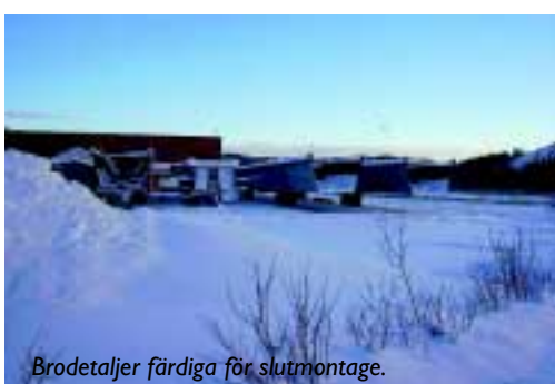
Brodetaljer färdiga för slutmontage.

Bron blir en del av förbindelsen mellan fastlandet och ön Tautra. För att förhindra att rovdjur besöker ön med dess känsliga djur- och naturliv, kommer bron att förses med grindar.