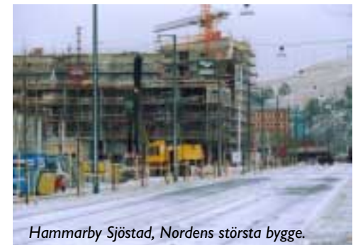
Hammarby Sjöstad, Nordens största bygge.