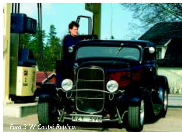
Ford 3 W Coupé Replica.