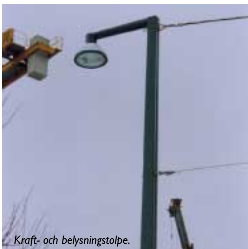
Kraft- och belysningstolpe.

Smidesbolaget har haft ett totalansvar för både tillverkning och montage av stolparna. Bockning, förzinkning, målning och montage har skett med hjälp av underleverantörer till Smidesbolaget.